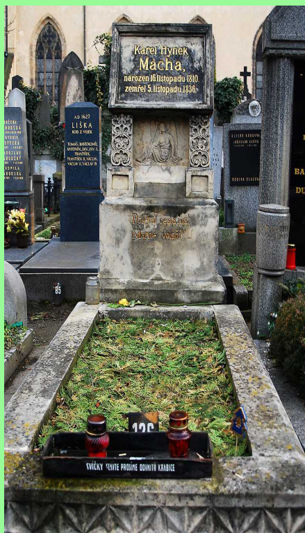
hrob K. H. Máchy na vyšehradském hřbitově

? Proč K. H. Mácha zemřel v tak mladém věku? Jaké byly okolnosti jeho smrti? Pokud vás to zajímá, vyhledejte odpovědi na internetu.