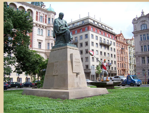
Pomník A. Jiráska